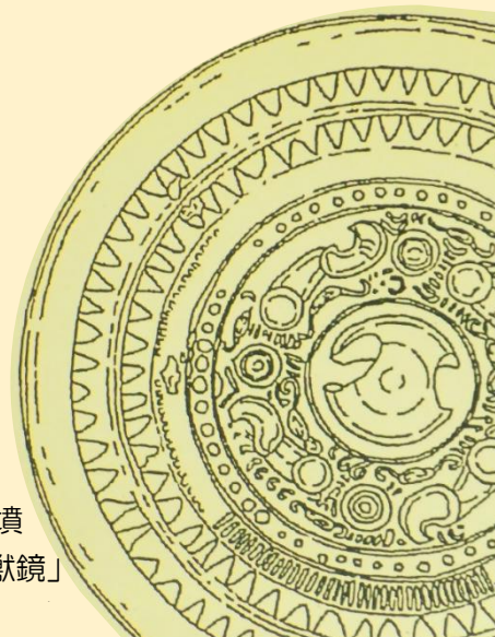
佐世保市鬼塚古墳 「四獣鏡」